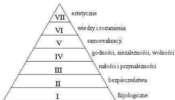
Rysunek 1. Piramida Masłowa

Oprócz trwania i przetrwania, bezpieczeństwo stanowią takie wartości, jak suwerenność, niezawisłość, przeżycie ludności, system społeczny i gospodarczy, prestiż na arenie międzynarodowej, ideologię, własnych obywateli za granicą, dostęp cywilizacyjny oraz standard życia obywateli. Bezpieczeństwo to proces, w którym stan bezpieczeństwa i jego organizacja podlegają nieustannym przemianom stosownie do naturalnych oddziaływań warunków bezpieczeństwa (Biała Kięga 2013, s. 4). Inna definicja bezpieczeństwa utożsamiana jest z naczelną potrzebą człowieka oraz grup społecznych (Głowacki 2004, s. 26).