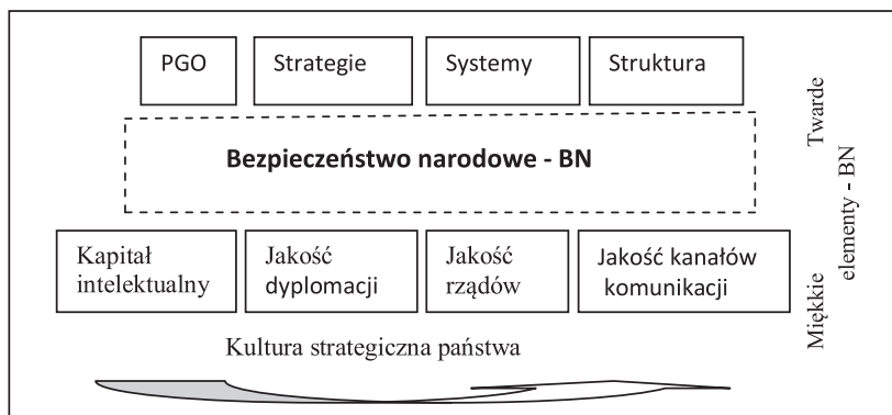
Rysunek 1. Model organizacyjny systemu bezpieczeństwa (8- E), obejmujący twarde i miękkie elementy bezpieczeństwa narodowego

Model jest wynikiem modelowania. Pod pojęciem tym rozumiemy proces budowy i badania modeli. Modelowanie jest ważnym narzędziem analitycznym (badawczym). (Sułek 2010, s. 94). Model organizacyjny systemu bezpieczeństwa (8-E), obejmuje twarde i miękkie elementy bezpieczeństwa narodowego, (rysunek 1).