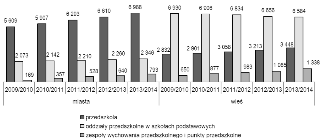
Wykres 2. Placówki przedszkolne w mieście i na wsi w latach 2009-2013