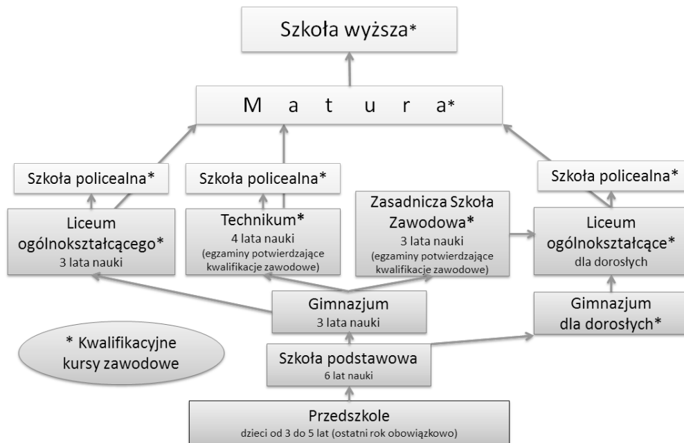
Schemat 1. Obowiązujący schemat systemu edukacji (na dzień 5 maja 2015r)